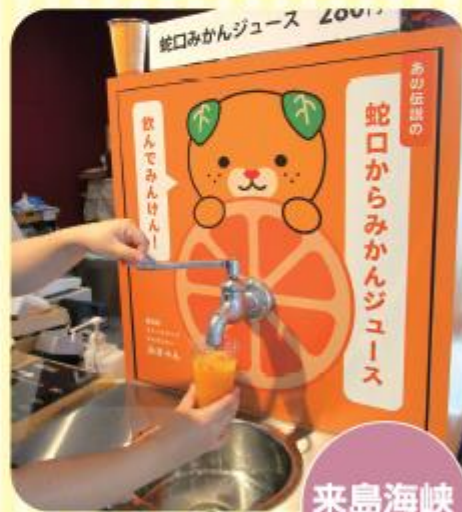
来島海峡SAの「蛇口みかんジュース」