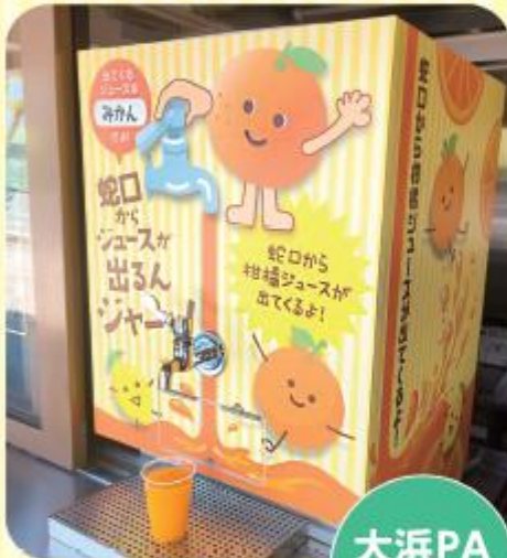
大浜PA(下り線)の「蛇口からみかん」